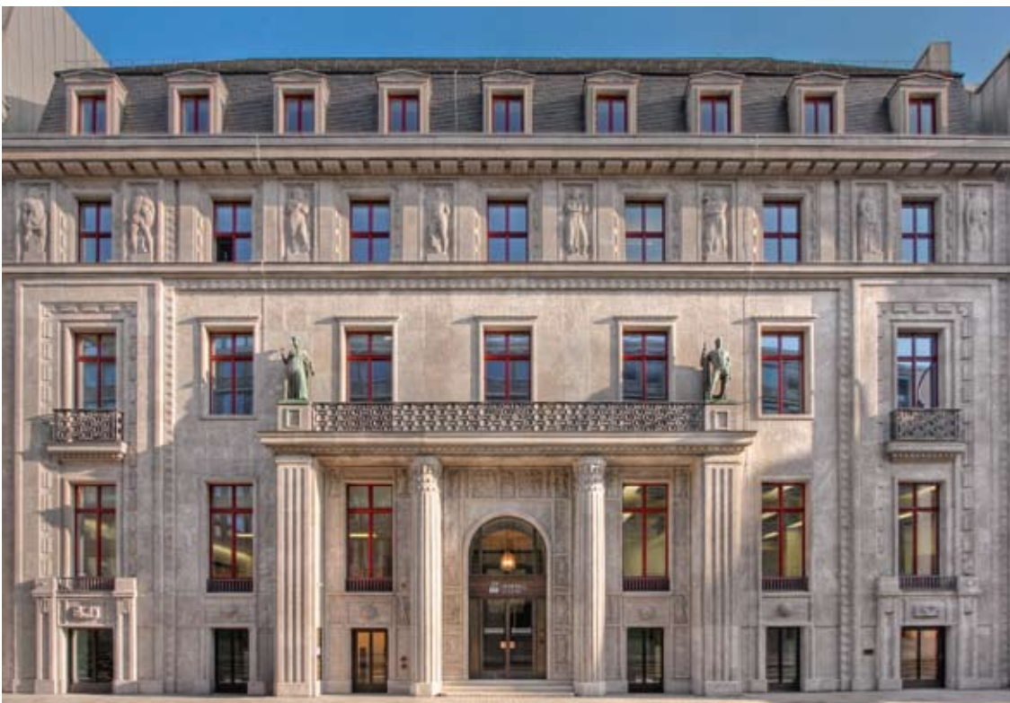
Generali Investments Deutschland mit Sitz in Köln.

In der Verwaltung der Finanzanlagen aller Versicherungen der Generali Gruppe stehen neben der Rendite auch immer die Sicherheit und die Kontrolle der Risiken im Vordergrund. Das in diesem Bereich erworbene Know-how setzen wir im Fondsmanagement aktiv für Ihren Anlageerfolg ein.